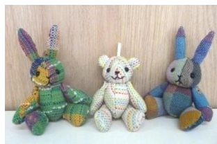
かわいいキーホルダーは1つ2000円です