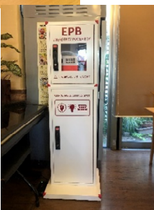
防災タワー われもこうビル1階 に設置してあります