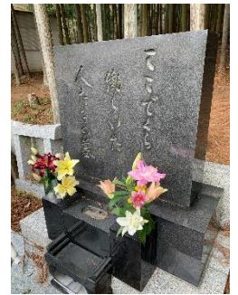
こころみ学園のお墓