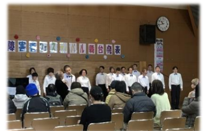
音楽クラブが舞台上で合唱を披露しました

ですが残念なことに、参加団体数がコロナ禍以前にはまだ戻っていません。障害者フェスティバルは単なる楽しいイベントというだけではありません。多くの人々に自分たちのことを知ってもらえる場であるということを、改めて多くの皆さんにお伝えしたいです。