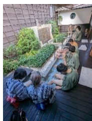
星音の湯にて皆で足湯