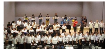
令和元年の音楽交流フェスタ