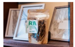
翠茎茶(アスパラ茶)

アスパラ茶の製造は、令和3年5月より試行錯誤しながら始まりました。あかねの会の担当は、本来は廃棄されていたアスパラガスの茎の乾燥と焙煎です。特に課題となったのは焙煎作業で、大型の焙煎機を導入しましたが、アスパラの太さや室内の気温・湿度によって焙煎する時間を調整する必要があります。焙煎はお茶の味に大きく影響するため、今でも慎重に行っている作業です。これからも利用者と共に、ていねいな作業を通して地域とのつながりを作り続けていきます。