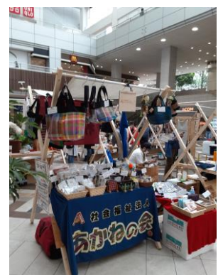
サスティナブルマーケットの様子

このコロナ禍で、いままで出展していた「地区祭」や「障害者フェスティバル」等、練馬区のイベントが軒並み中止になり、日本橋などで行われている「ハッピースマイルフェスタ」も一年以上中止が続いています。そんな中で、練馬区役所での「ふれあいバザール」や「ねりいち」は、緊急事態宣言中に一時中断されたものの、再開しました。光ヶ丘 IMA の光の広場で行われた「サスティナブルマーケット」や「ハンドメイドマーケット」、有楽町での「Tokyo Tokyo オールジャパンコレクション」(オリパラ販売会)にも、初めて参加できました。利用者の工賃向上のために、今後も新しいチャンスを見つけて販売会に参加し続けていきます。あかね通信に販売会の予定を掲載していますので、ぜひお越しいただければ幸いです。