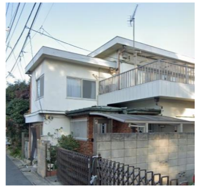
第三みずき寮 外観とリビング